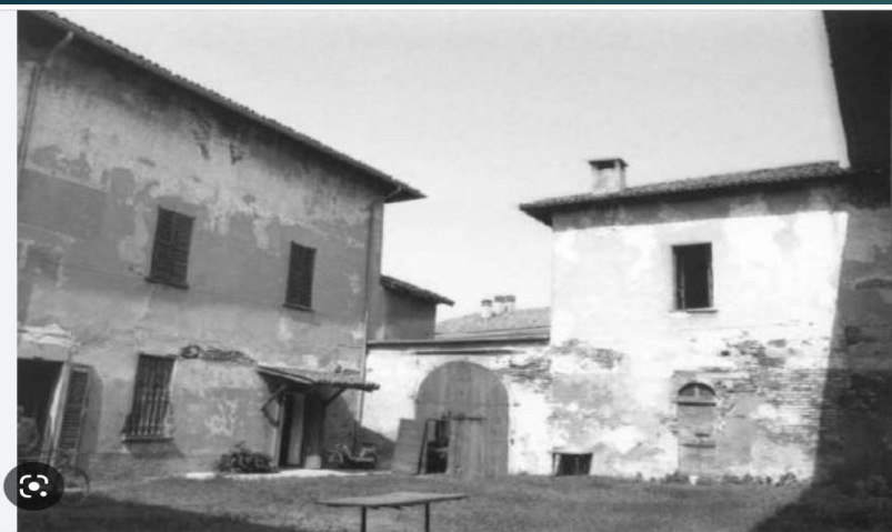
Castello di Mairano, Piazza Roma - Noviglio (MI) -